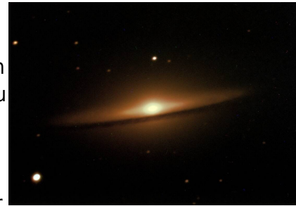
M 104 - Sombroergalaxie

Das astronomische Praktikum richtet sich an Bachelorstudenten. Ziel ist es einen ersten Umgang mit astronomischen Instrumenten sowie die grundlegenden Forschungsmethoden der Astrophysik zu erlernen. Das astronomische Praktikum setzt sich aus mehreren Beobachtungen zusammen. Zu jedem wird ein Testat durchgeführt und es ist ein kurzes Protokoll anzufertigen. Die Beobachtungen werden an der Übungssternwarte des Instituts für Physik und Astronomie der Universität Potsdam durchgeführt. Im Rahmen eines begleitenden Seminars (alle 14 Tage) werden in, durch die Studenten vorbereiteten Vorträgen, die grundlegenden Prinzipien vorgestellt sowie die Ergebnisse der Versuche diskutiert. Die Benotung ergibt sich aus der Bewertung der Testate, Protokolle sowie der gehaltenen Seminarvorträge.