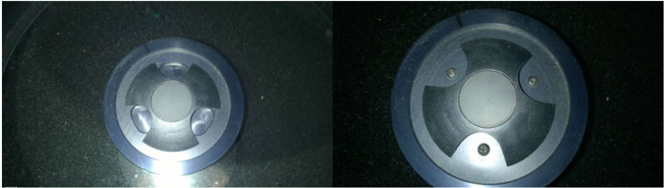
Sekundärspiegel (rechts mit gedrehter Abdeckung, sodass die Einstellschrauben sichtbar sind)

ACHTUNG: AN DEN SCHRAUBEN SIND JEWEILS NUR KLEINSTE VERÄNDERUNGEN NÖTIG!