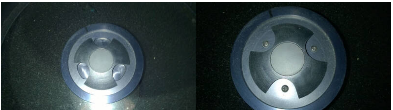
Sekundärspiegel (rechts mit gedrehter Abdeckung, sodass die Einstellschrauben sichtbar sind)

ACHTUNG: AN DEN SCHRAUBEN SIND JEWEILS NUR KLEINSTE VERÄNDERUNGEN NÖTIG!