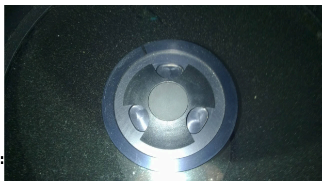
Schmidtplatte mit Staub und Pollen