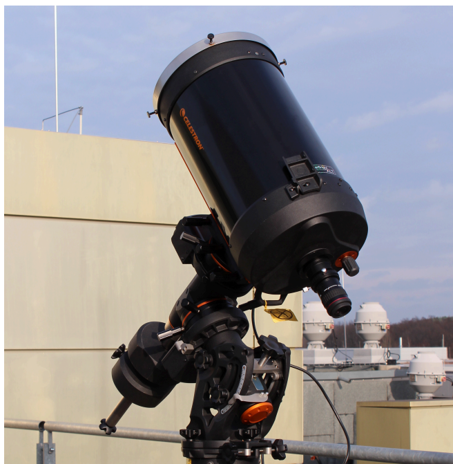
Das C11 auf der CGE Pro