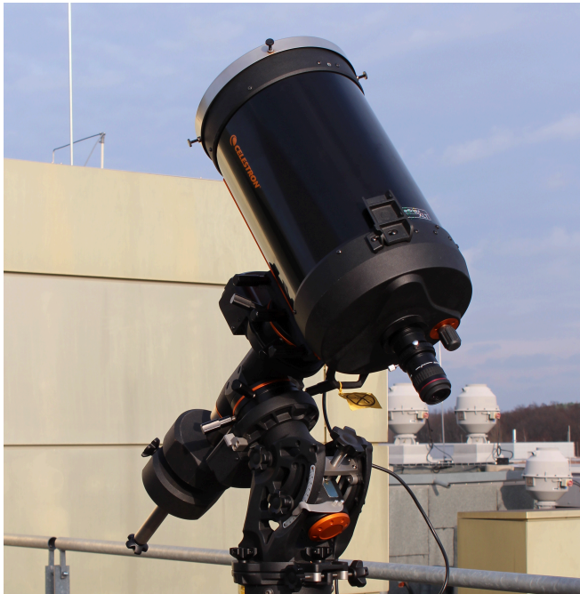
Das C11 auf der CGE Pro