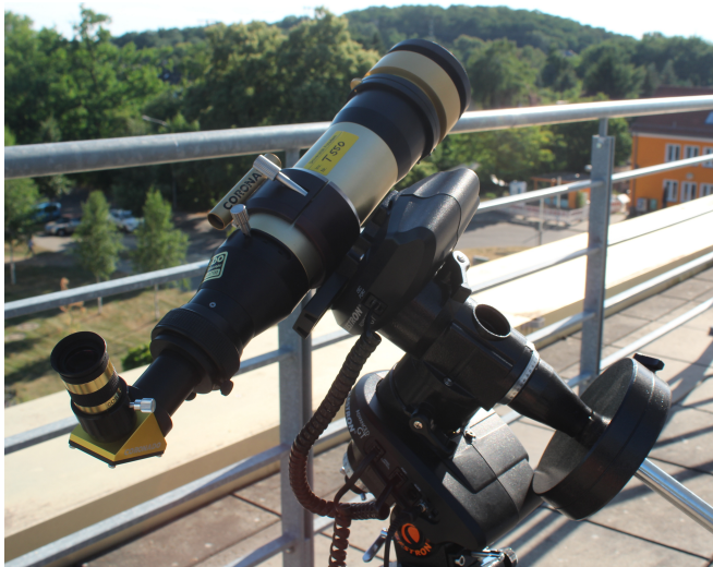
Das Solar Max II auf der Advanced GT