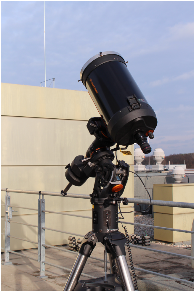
Das C11 auf der CGE Pro