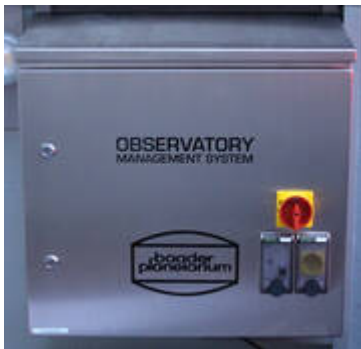
Observatory Management System (OMS)