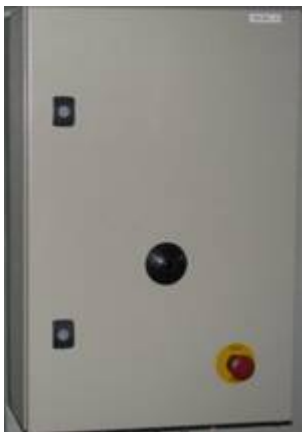
Steuerkasten mit Notschalter