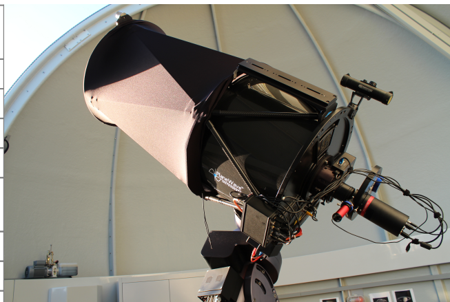
OST 2.0: Das CDK20 von Planewave mit QHY600M und Sti