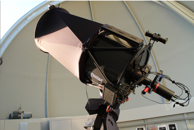
OST 2.0: Das CDK20 von Planewave mit QHY600M und Sti