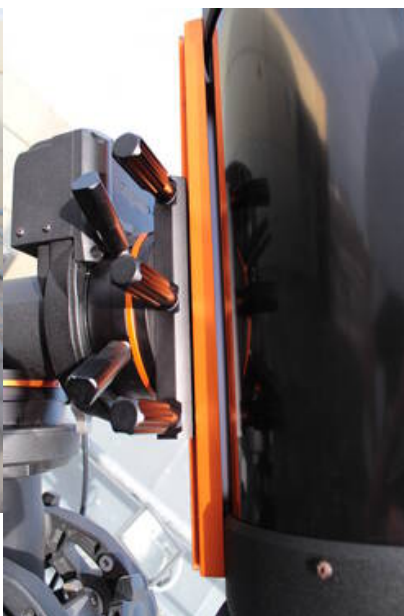
Fig. 15: Montage des C11 an der CGE PRO