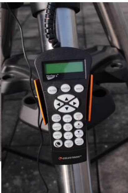
Fig. 11: Handterminal