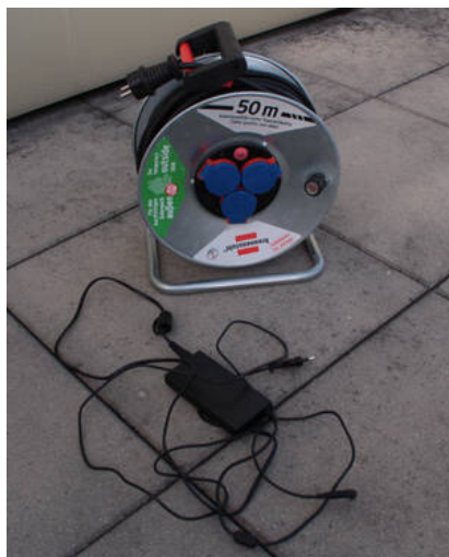
Fig. 10: Mobiles Netzteil und Kabeltrommel