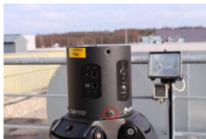
Fig. 2: Stativ mit der Elektronikbox der CGE PRO (der rote Kreis markiert eine der Schrauben welche die Elektronikbox am Stativ fixiert)