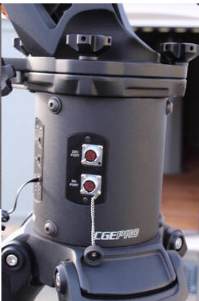
Fig. 8: Elektronikbox mit den Anschlüssen für die Kabel zu den Rektaszensions- und Deklinationsmotoren