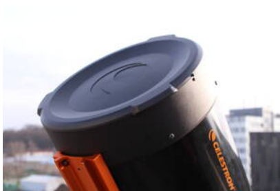
Fig. 16: Tubus mit Abdeckung