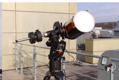
Fig. 18: Fertig aufgebautes Teleskop