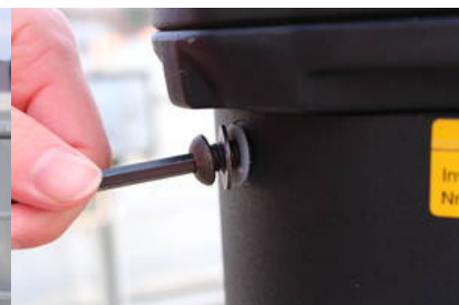
Fig. 3: Eine der Schrauben an der Elektronikbox