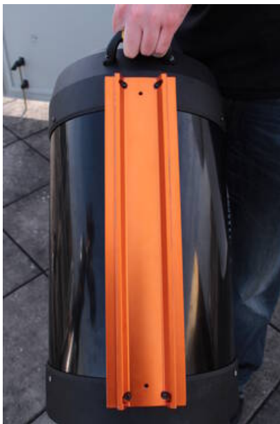
Fig. 13: Schwalbenschwanz am Tubus