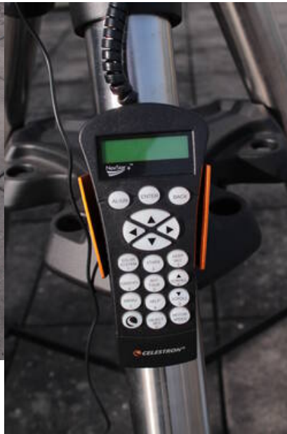
Fig. 11: Handterminal