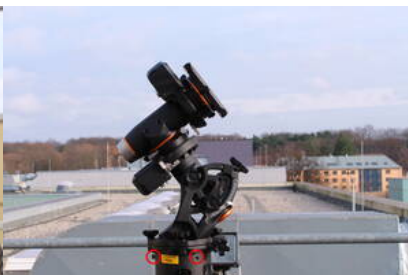
Fig. 5: CGE PRO aufgesetzt auf die Elektronikbox und das Stativ (die roten Kreise markieren die Schrauben welche die CGE PRO an der Elektronikbox fixieren)