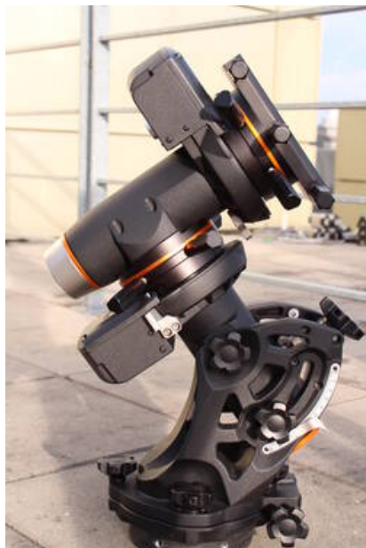
Fig. 4: CGE PRO