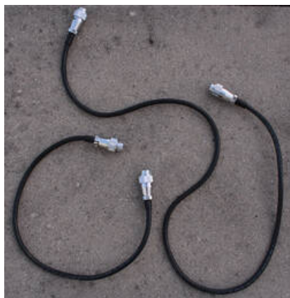
Fig. 7: Kabel für die Verbindung zwischen den Motoren und der Elektronikbox