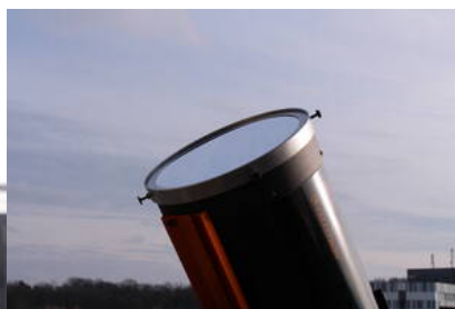
Fig. 17: Tubus mit Sonnenfilter