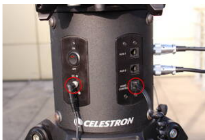
Fig. 12: Anschlüsse für das Netzteil (links) und das Handterminal (rechts) an der