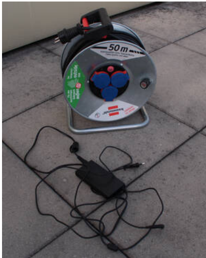
Fig. 10: Mobiles Netzteil und Kabeltrommel