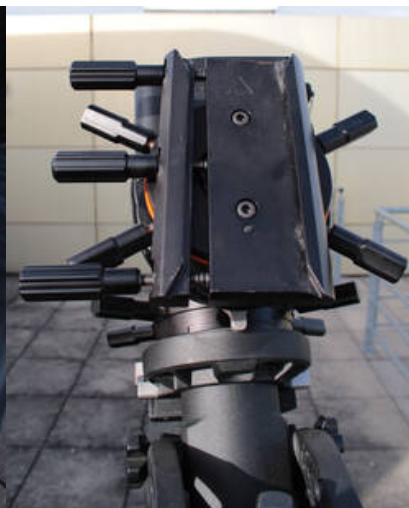
Fig. 14: Schwalbenschwanzklemme an der CGE PRO