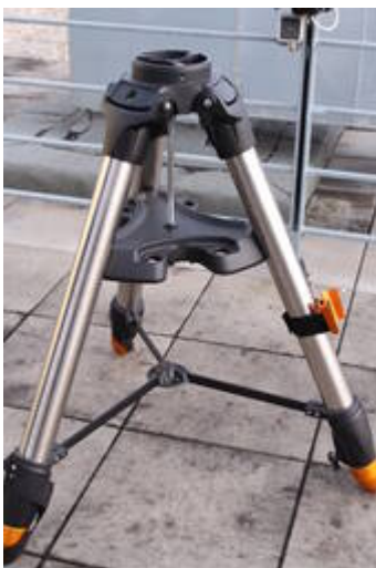
Fig. 1: Stativ für die CGE PRO