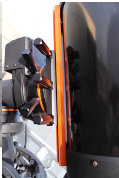
Fig. 15: Montage des C11 an der CGE PRO