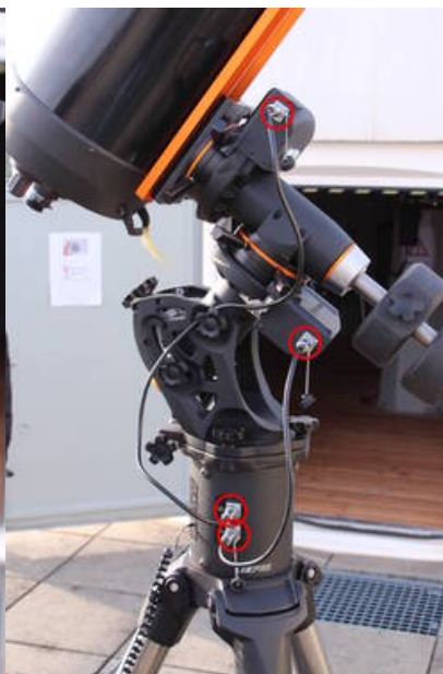
Fig. 9: CGE PRO mit den hergestellten Kabelverbindungen zur Elektronikbox