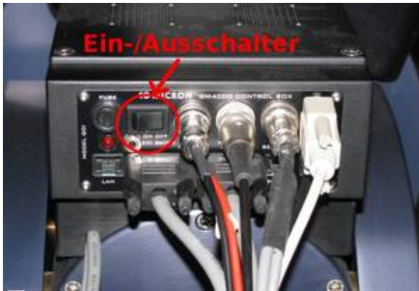
Steuereinheit an der Montierung

Zur Einstellung von Datum und Uhrzeit kommt man im Handterminal durch folgende Tastenkombination: