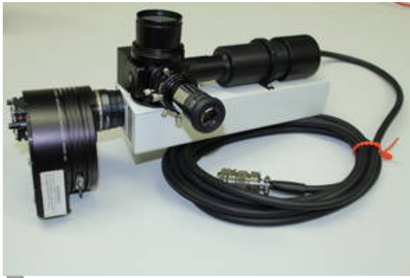
Aufnahme unseres neuen BACHES-Spektrographens

User neuer Echelle-Spektrograph von Baader Planetarium, welcher mit dem Max-Planck-Institut für extraterrestrische Physik entwickelt wurde bietet folgende Eigenschaften.