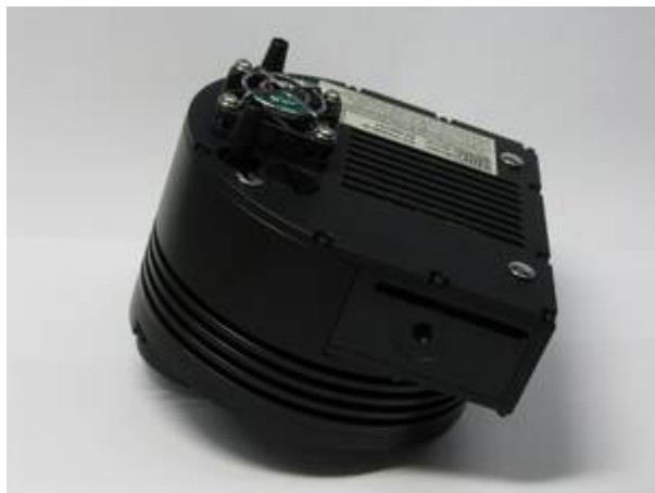
Unsere SBIG ST-8