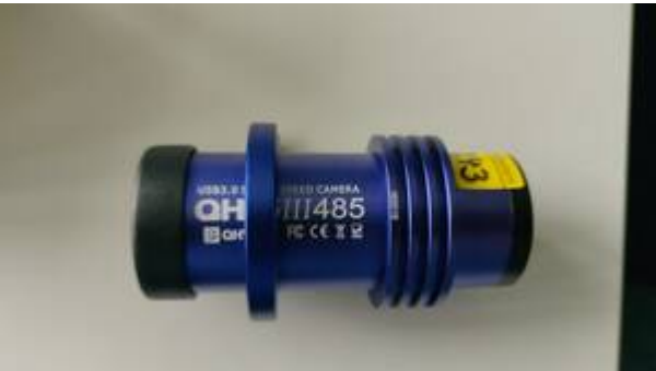
Unsere QHY 485