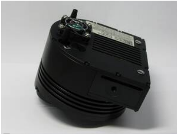
Unsere SBIG ST-8