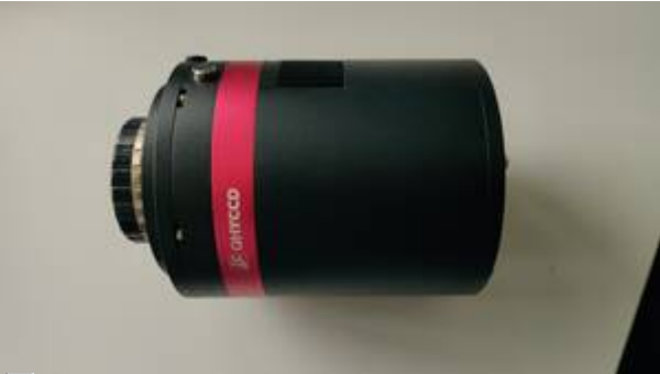
Unsere QHY 268