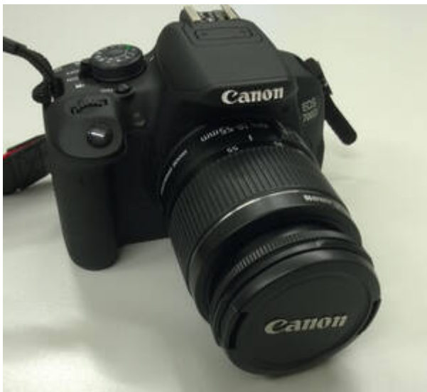
Unsere DSLR (Canon EOS 700D)