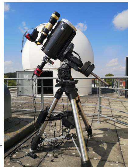
Ein Teil unseres Equipments